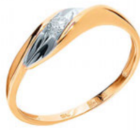
SUNLIGHT, 15 990 РУБ.