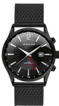
GEORGE KINI, 16 700 РУБ.