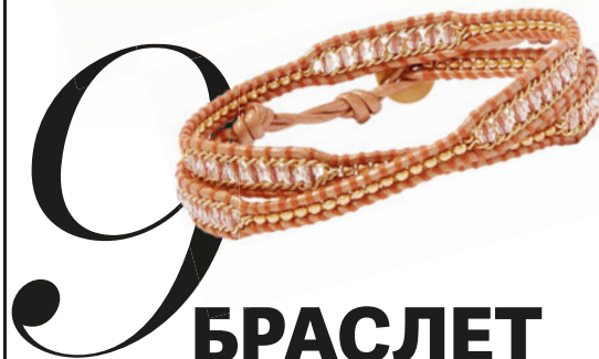
CHAN LUU, 9334 РУБ.