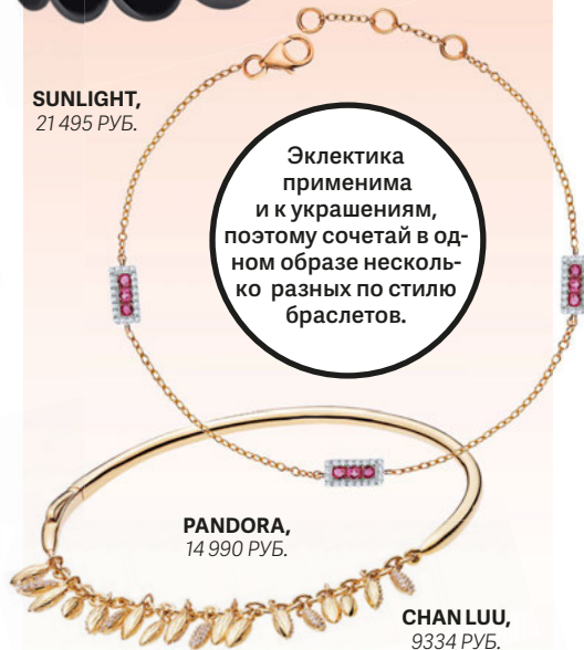
PANDORA, 14 990 РУБ.

Эклектика применима и к украшениям, поэтому сочетай в одном образе несколько разных по стилю браслетов.