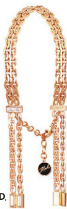
KARL LAGERFELD, 31 521 РУБ.