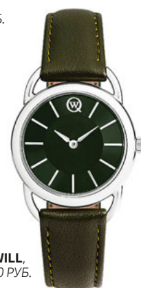
QWILL, 3500 РУБ.