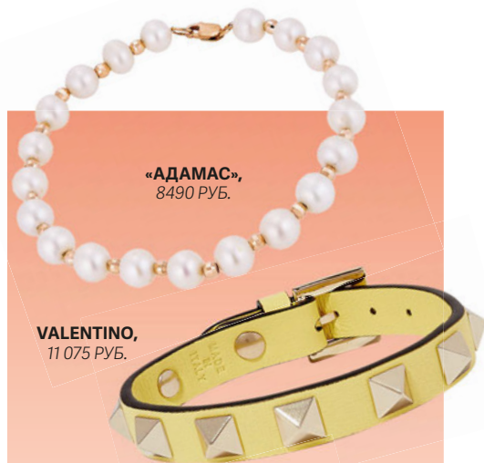
«АДАМАС», 8490 РУБ.