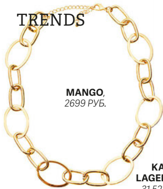
MANGO, 2699 РУБ.