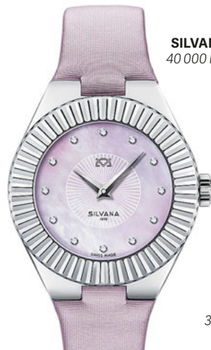
SILVANA, 40 000 РУБ.