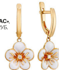
«АДАМАС», 15 990 РУБ.