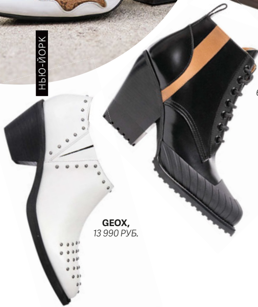
GEOX, 13 990 РУБ.

Ботильоны со скошенным каблуком одинаково хорошо смотрятся и с джинсами, и с платьями, и даже с классическими брюками.