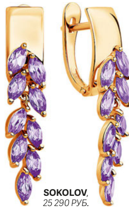
SOKOLOV, 25 290 РУБ.