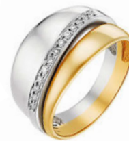
«АДАМАС», 28 990 РУБ.