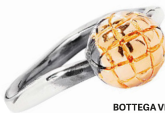
BOTTEGA VENETA, 14 578 РУБ.