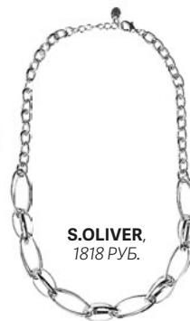
S.OLIVER, 1818 РУБ.