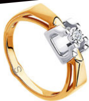
SOKOLOV, 41 990 РУБ.