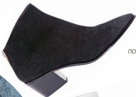
DKNY, ЦЕНА ПО ЗАПРОСУ