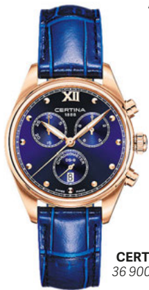
CERTINA, 36 900 РУБ.