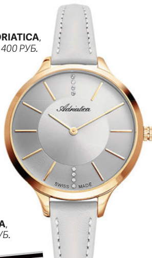
ADRIATICA, 12 400 РУБ.