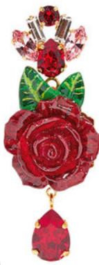
DOLCE & GABBANA, ЦЕНА ПО ЗАПРОСУ