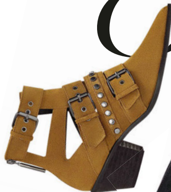
ZARA, 6999 РУБ.

У дизайнеров все фигуры давно «под каблуком»! Круглые и квадратные формы были актуальны летом, теперь пришло время скошенных и трапециевидных.