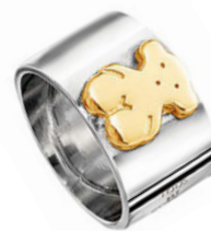
TOUS, 7600 РУБ.